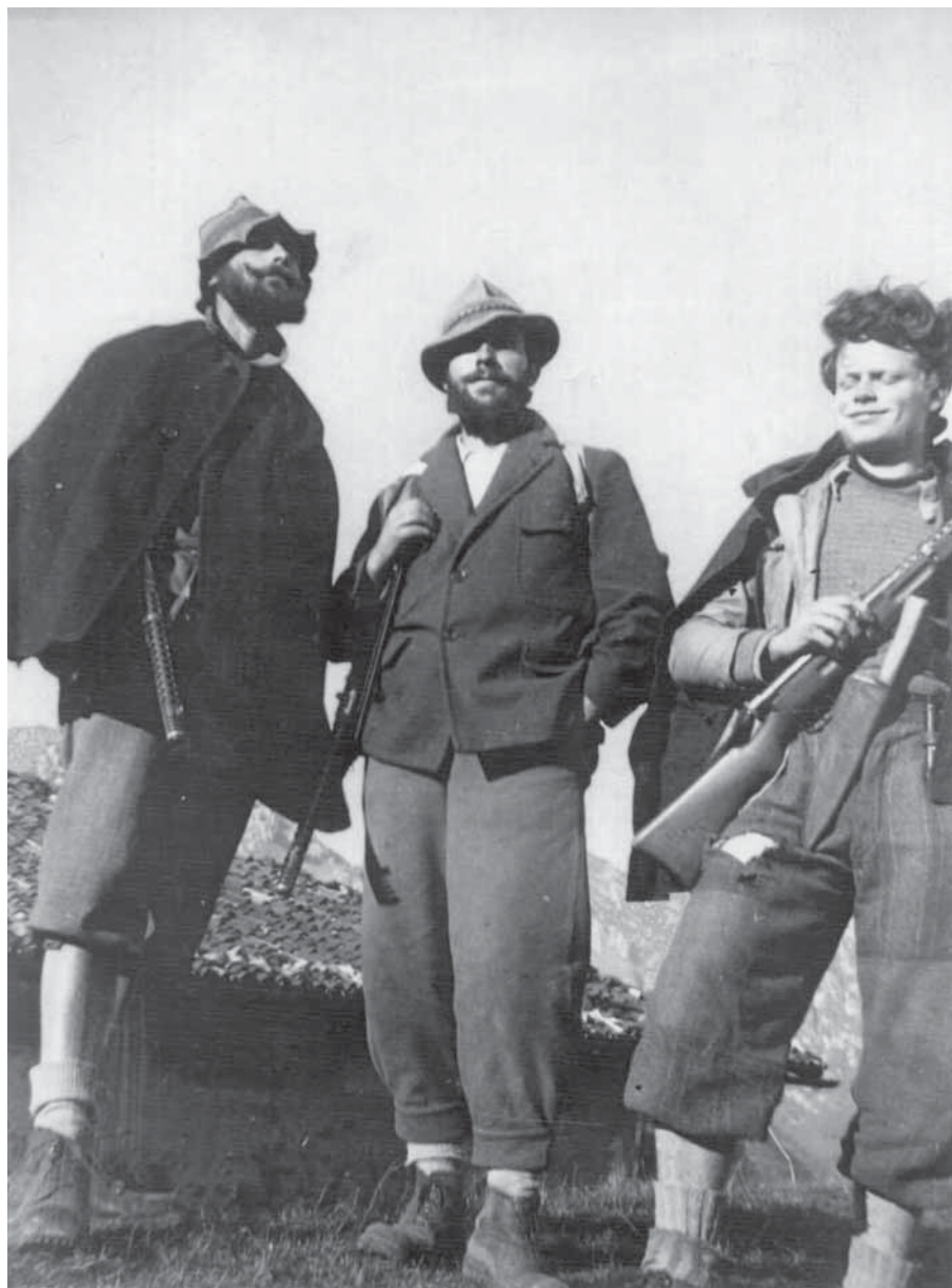
Così equipaggiati e armati i partigiani combattevano e morivano per la libertà (ribelli della Brigata Perlasca).