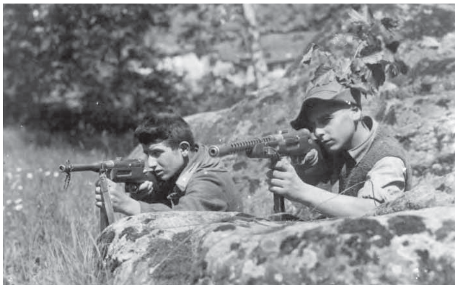
"Boccia", 16 anni e "Pino", 17 anni, ribelli della Brigata Perlasca.