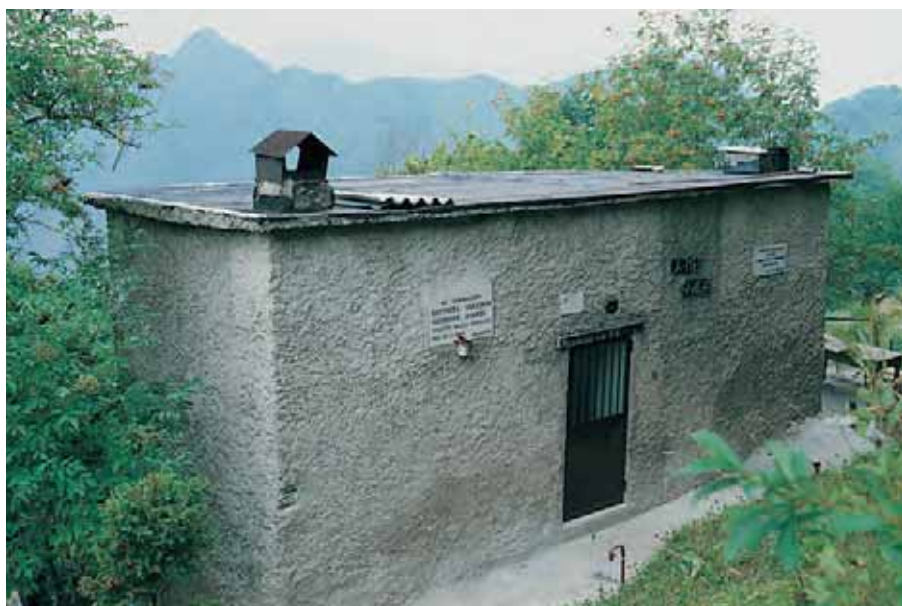
La chiesetta al Campo del Gallo (sopra) e il ristrutturato casinetto della Tesa Guizzi. Vi sono murate le lapidi in ricordo rispettivamente di sei e di due partigiani caduti nel combattimento del Sonclino.