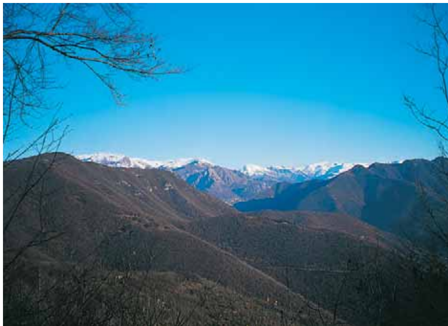
Dal "Quadrone" di Monte Magnoli, veduta sull'Alta Val Trompia.